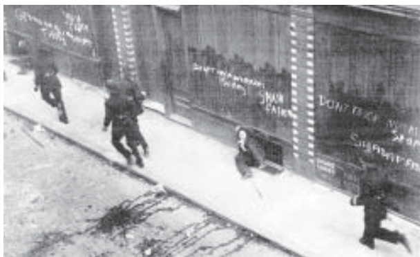
La batalla de Cable Street, Londres, 4 de octubre, 1936. Los letreros dicen "No toques las tiendas de los trabajadores. Aplasta el fascismo"

en la lucha por un mundo mejor: un mundo sin políticos, generales, curas ni jefes. Aunque no nos vemos como un grupo de gurús con respuestas para todo sí pensamos que tenemos algunas ideas y propuestas que pueden ser útiles para la clase obrera. Tenemos también una idea muy clara de cómo conseguir un mundo sin explotación.