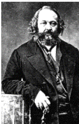
Bakunin, uno de los fundadores del anarquismo moderno

a desarrollar ideas anarquistas (las de los llamados Enragés ). Fue en la Comuna de París de 1871 cuando los trabajadores y trabajadoras franceses crearon realmente organizaciones de control obrero que desafiaron al antiguo sistema durante un breve período de tiempo, antes de ser ahogadas en sangre. En las Revoluciones rusas de 1905 y 1917 los trabajadores y campesinos desarrollaron estructuras parecidas de control obrero directo, como los consejos obreros y los comités de fábrica. La conquista del poder por los Bolcheviques en octubre de 1917 no tiene nada que ver con esto. Igualmente en la Revolución húngara de 1956 los trabajadores crearon consejos obreros cuando desbancaron a sus opresores "comunistas". Durante la revolución de mayo del 68 en Francia los centros de trabajo y las universidades fueron ocupadas y en muchos casos dirigidas con métodos casi anarquistas.