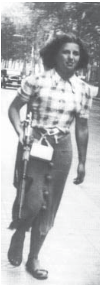
Barcelona, 27 de julio de 1936

El movimiento anarquista se convirtió también en víctima de la represión bolchevique y muchos anarquistas fueron fusilados, encarcelados o deportados. Los