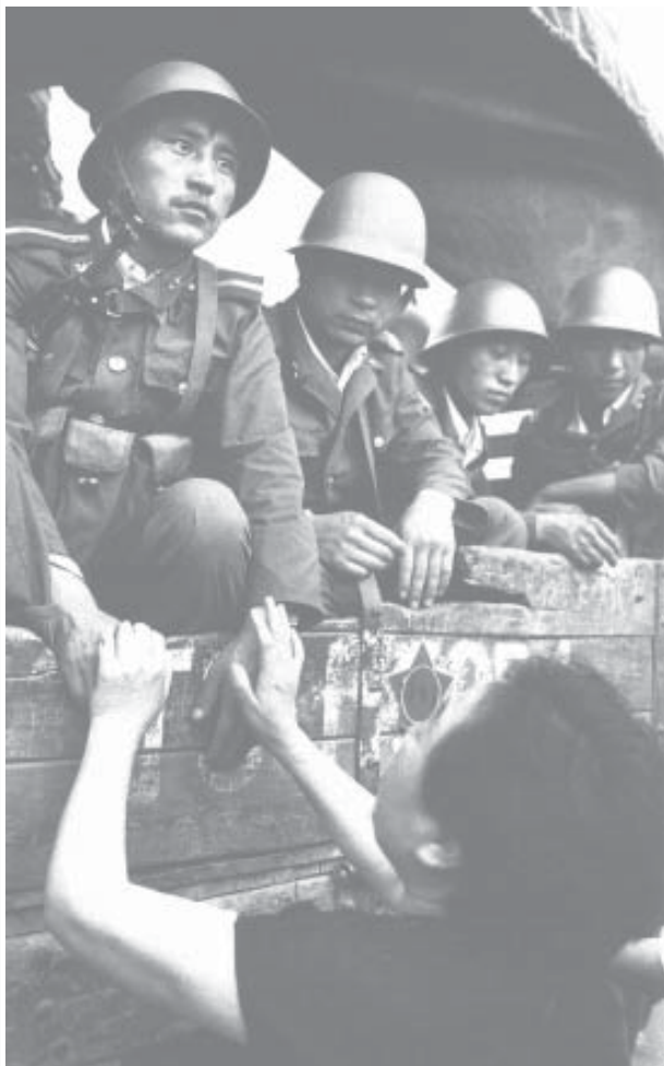
Plaza de Tian-an-men, Pekín, 3 de julio de 1989 Al día siguiente, estos soldados del Ejército Rojo estarán disparando contra el pueblo

pre: "los trabajadores no avanzan", dicen; "necesitan el liderazgo de organizaciones como las nuestras", insisten; "hay una crisis de liderazgo; sólo nosotros sabemos cómo