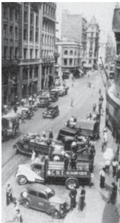
Distribución de alimentos colectivizada. Barcelona 1936

habían sido llamados por los bolcheviques en 1917 "la flor de la revolución", fueron considerados en 1921 "contra-revolucionarios" y "guardias blancos". ¿Cuál fue su crimen? Criticar la dictadura bolchevique sobre los Sóviets, que se habían convertido en cáscaras vacías y habían dejado de ser organizaciones del poder obrero. Los marineros de Kronstadt, al re-