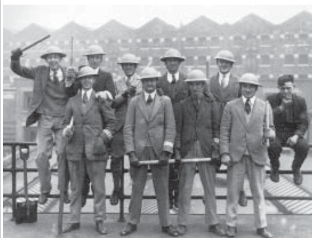
El otro bando: estudiantes de Oxford preparados para reventar la huelga general de 1926

mujeres de la clase obrera, para luchar contra la discriminación sexual, o grupos autónomos de trabajadores negros, al mismo tiempo que nos implicamos en la lucha contra el racismo y el fascismo. En los lugares de trabajo promovemos la creación de un movimiento sindical fuerte e independiente de los sindicatos oficiales y de los patronos, al mismo tiempo que intentamos crear grupos revolucionarios anarquistas en las fábricas para difundir el mensaje anarquista. En todos los casos la lucha por la libertad es una lucha contra el capitalismo.