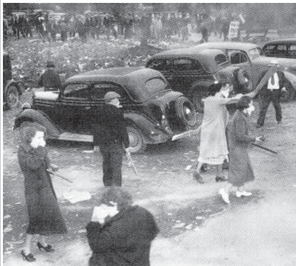
Piquetes de mujeres en la huelga de la Acería Newton, en Monroe, Michigan (EE.UU.), 1937

El Partido Laborista a veces usa la palabra "socialismo" para describir su política, ¡pero no muy a menudo! Repetimos: el Partido Laborista no es, y nunca ha sido, socialista. Este partido proporciona unos cuantos cientos de puestos de trabajo a arribistas de clase media pero nunca ha hecho grandes cosas por nadie. A pesar de varios gobiernos laboristas (¿hace cuántos años?) nunca cambió nada: seguía habiendo desempleo masivo, recor-