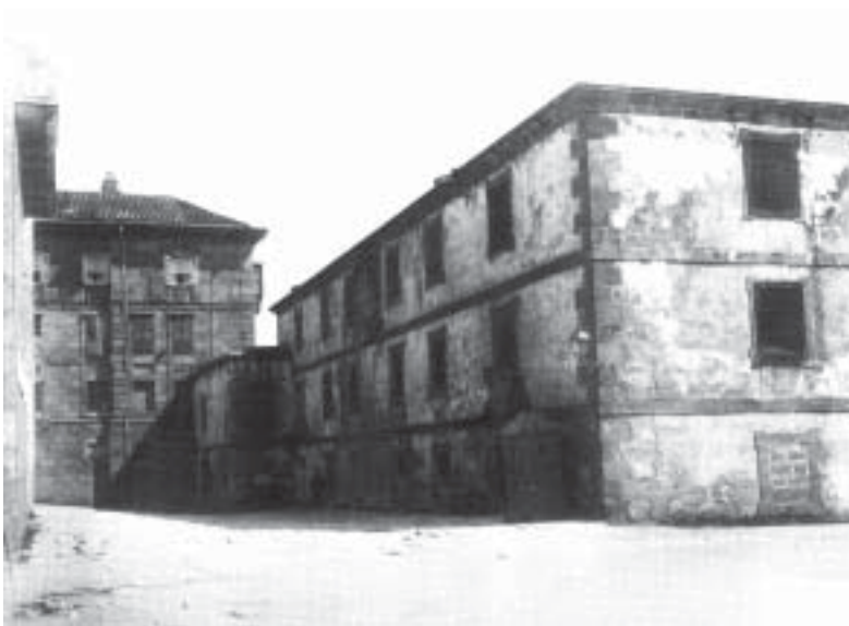
O antigo cárcere da Coruña, a carón da Capitania Xeral, en 1918