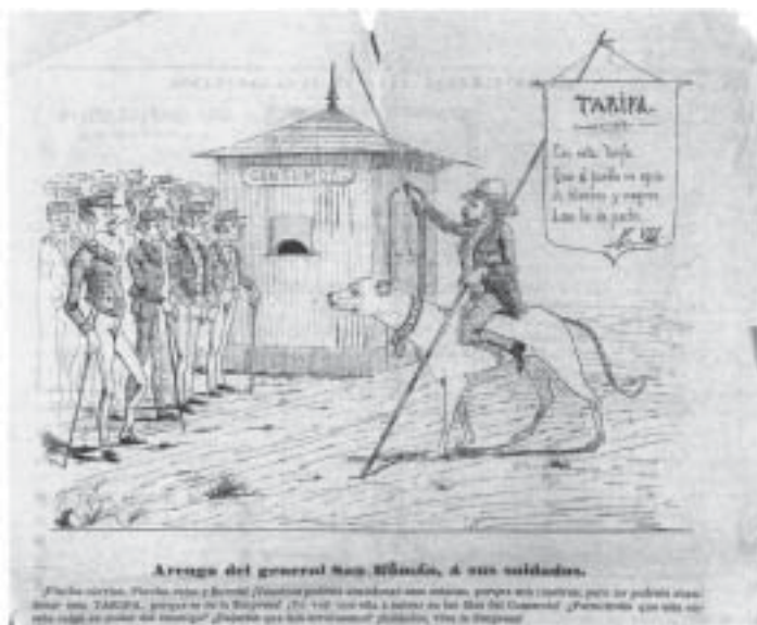
Grabado satírico sobre las tarifas de consumos. En El Duende . La Coruña, 8-VIII-1886. Real Academia Galega.