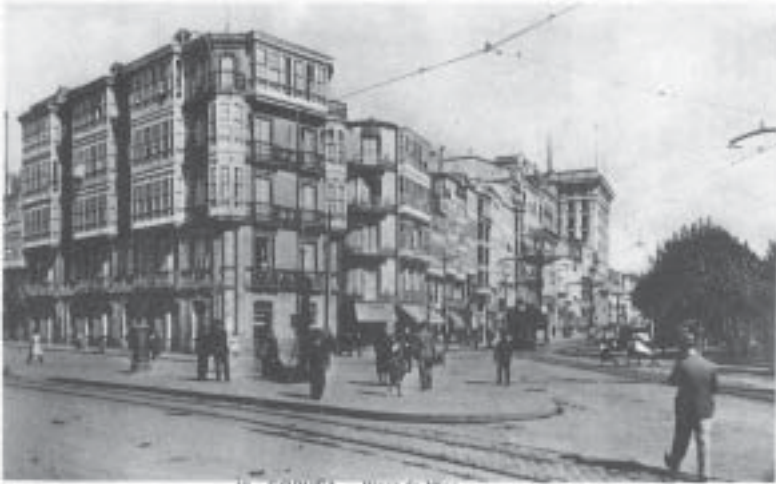
18. CORUÑA. — Plaza de Nino.