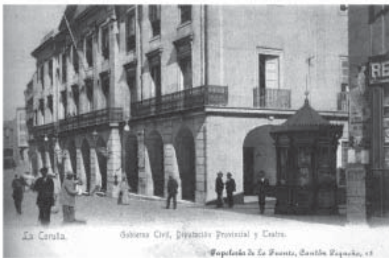
O antigo Governo Civil da Coruña en 1900