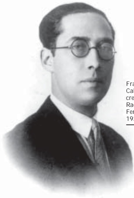
Francisco Iturralde Cabeza de Vaca, creador da «Escuela Racionalista» de Ferrol, asasiñado en 1936