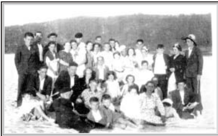
Traballadores ferroláns coas súas familias na praia de San Xurxo. Entre eles colaboradores e alumnos da «Escuela Racionalista»