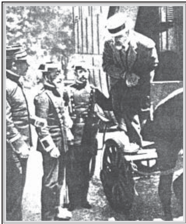
Detención de Francisco Ferrer